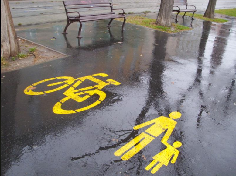
Budapest, Bem rakpart (décembre 2011)

Bonne Année 2011! Happy New Year! Buon Anno! Boldog Uj Evet! Glückliches Neujahr! E glückliches nēies! Un an nou fericit ! С Новым Годом ! Gelukkig Nieuwjaar ! Pace e salute !